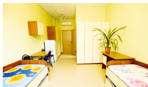
Иногородним студентам предоставляется общежитие