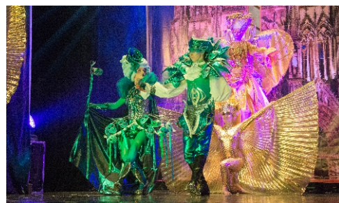
Насыщенная студенческая жизнь

25 октября 2017 г. – завершение приема документов (заочная форма)