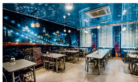
Уютные кафе с разнообразным меню по доступным ценам